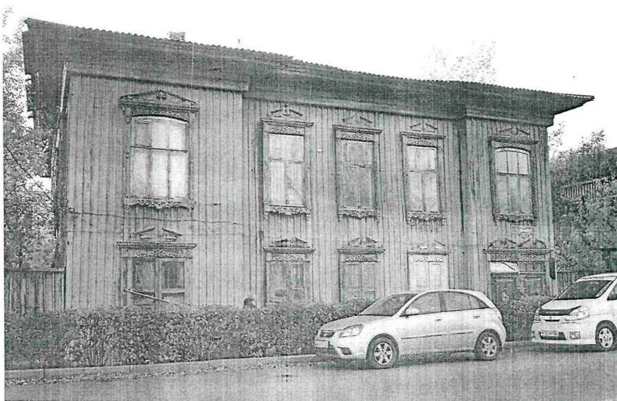
Фото 2. Флигель усадьбы, вид с востока