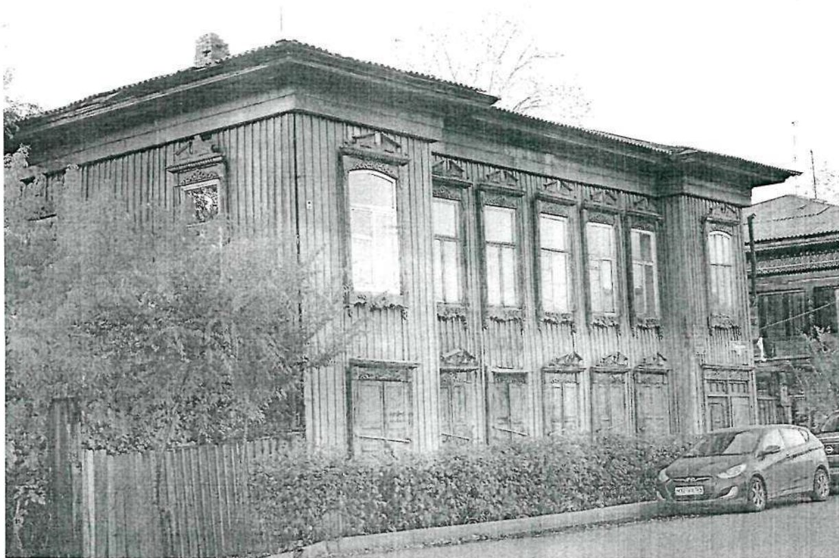
Фото 1. Дом жилой усадьбы, вид с юго-востока