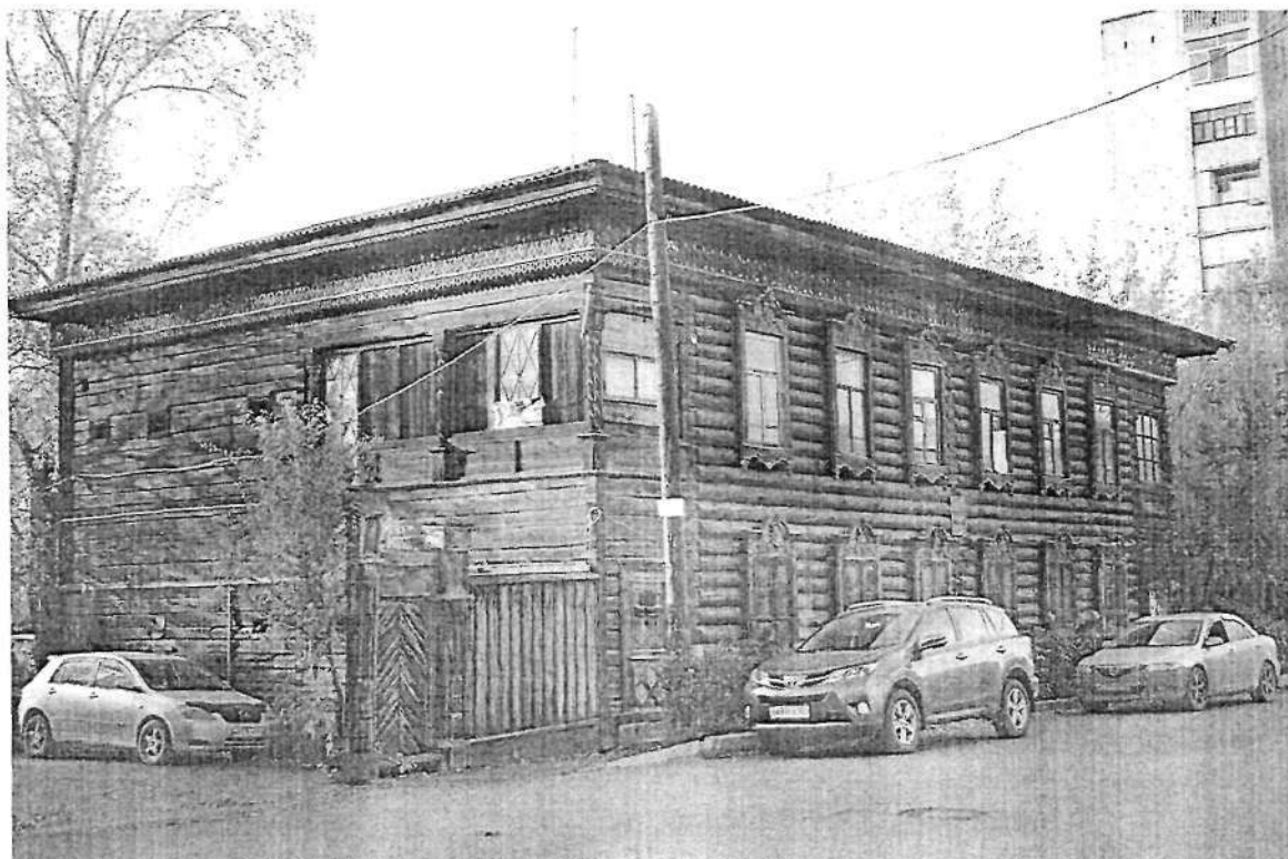
Фото 1. Вид с юго-востока

25. Дополнительные требования в отношении объекта культурного наследия: