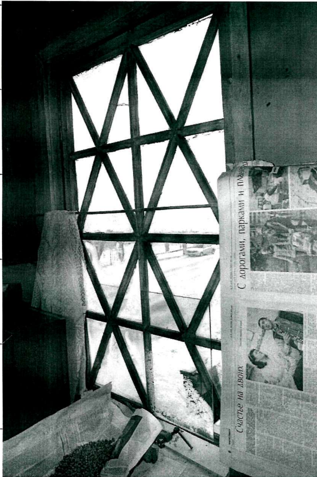
Фото 17. Интерьер второго этажа; оригинальная расстекловка оконного проема юго-восточной лестничной клетки (уровень второго этажа)