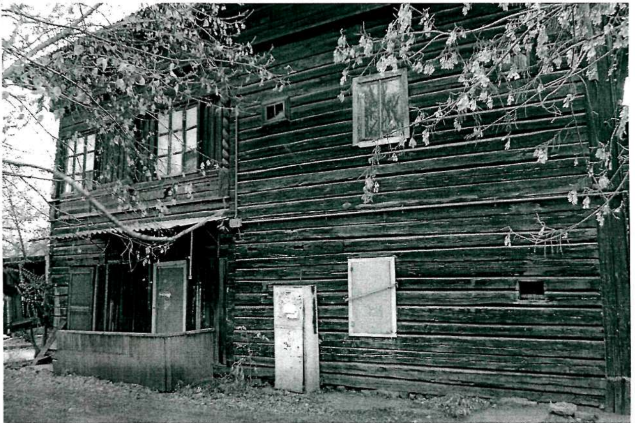
Фото 2. Северный фасад