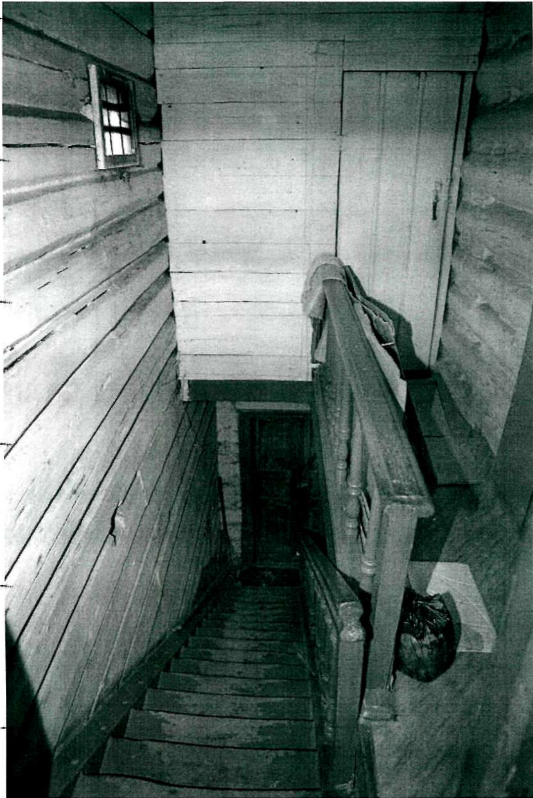
Фото 14. Интерьер; юго-западная лестница с ограждением из точеных балясин (фрагмент 3)