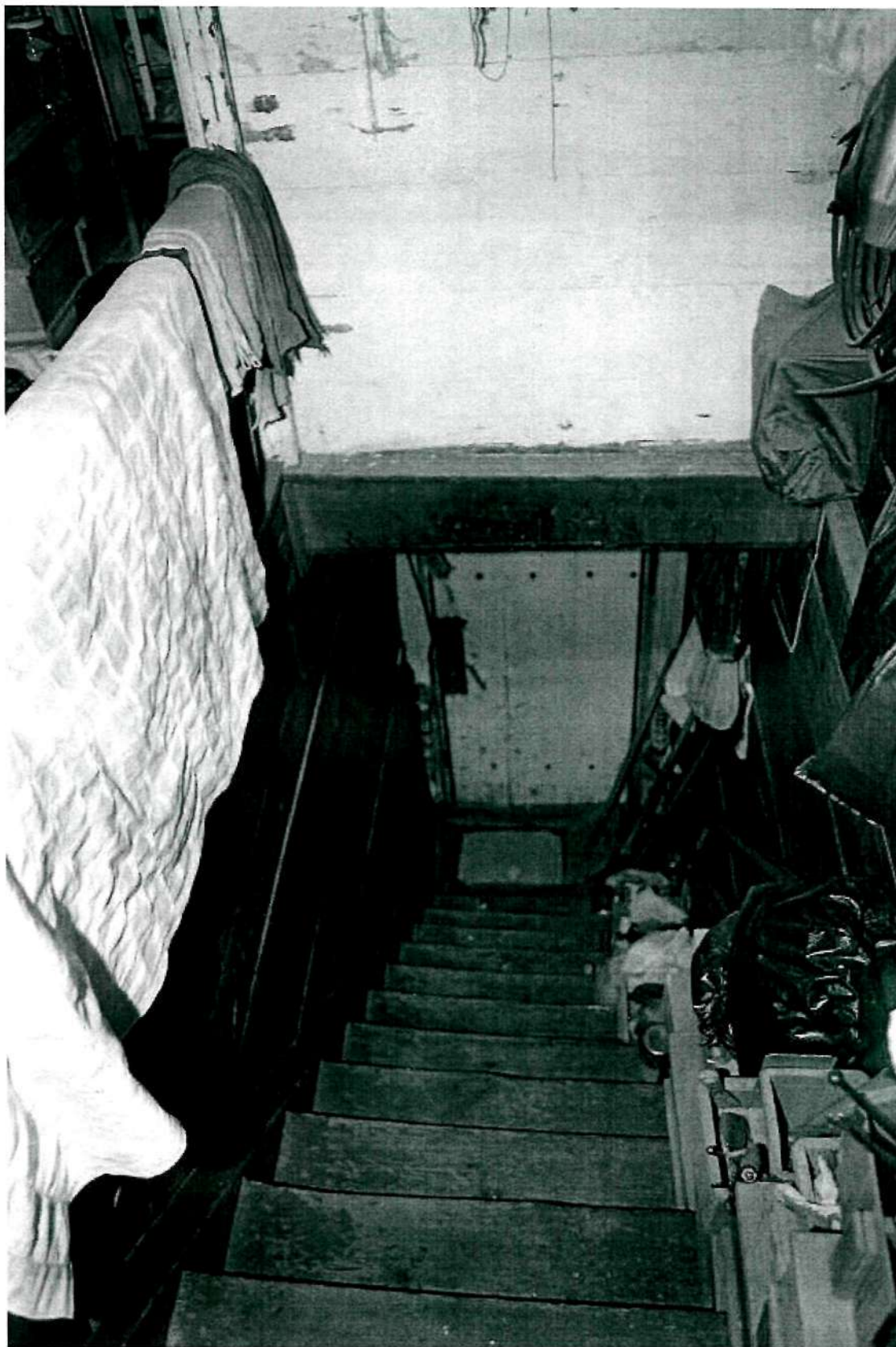
Фото 11. Интерьер; юго-восточная лестница