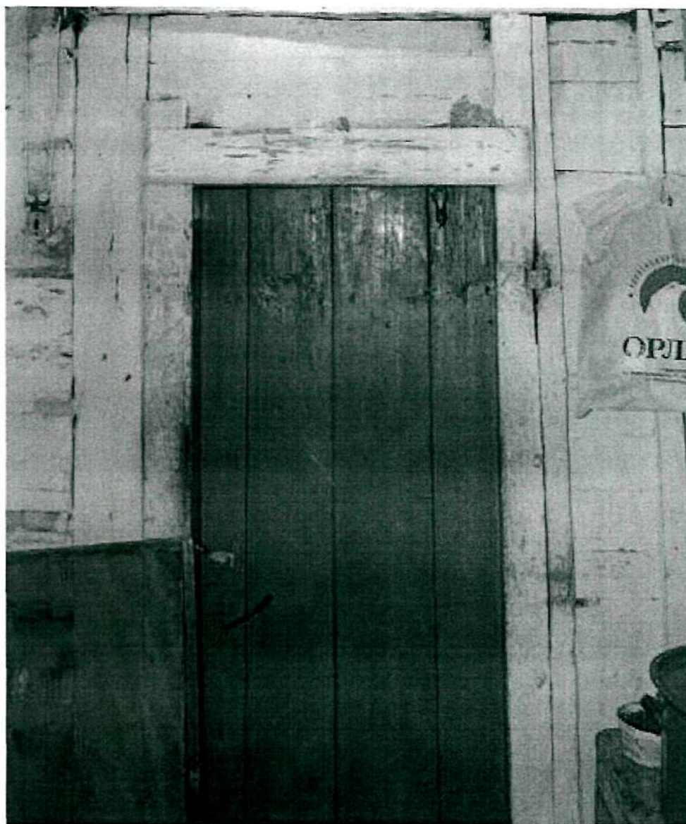
Фото 16. Интерьер второго этажа; плотничная дверь на площадке юго-западной лестничной клетки