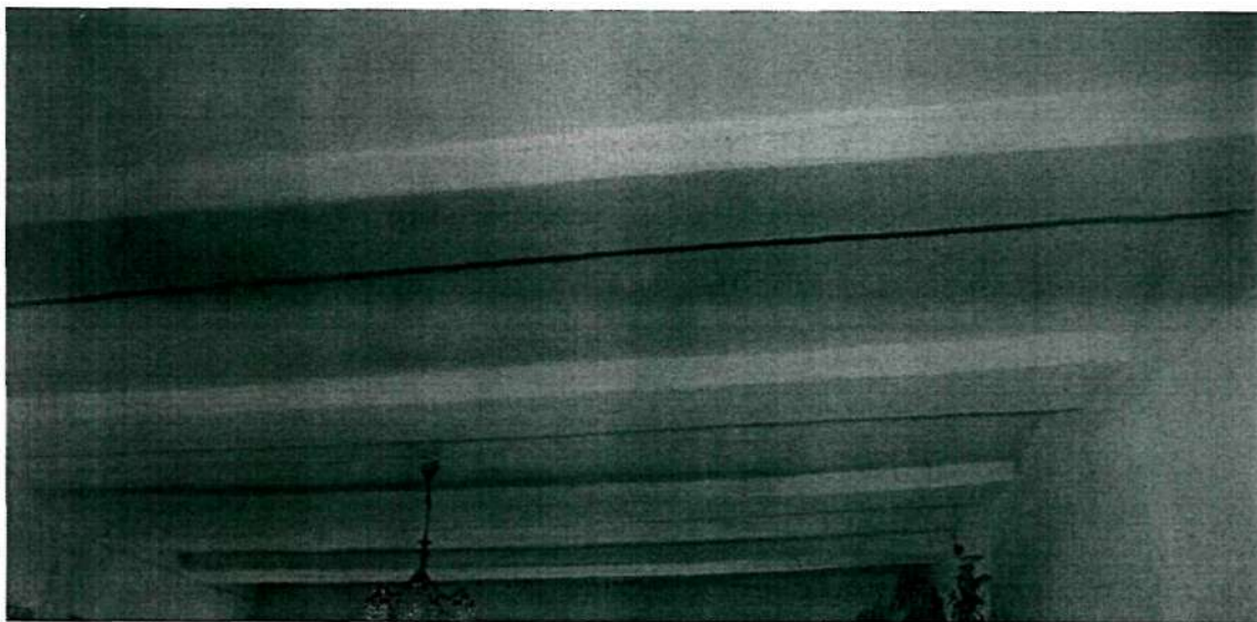
Фото 15 . Интерьер (фрагмент 1); характерный провис перекрытий в одном из помещений второго этажа