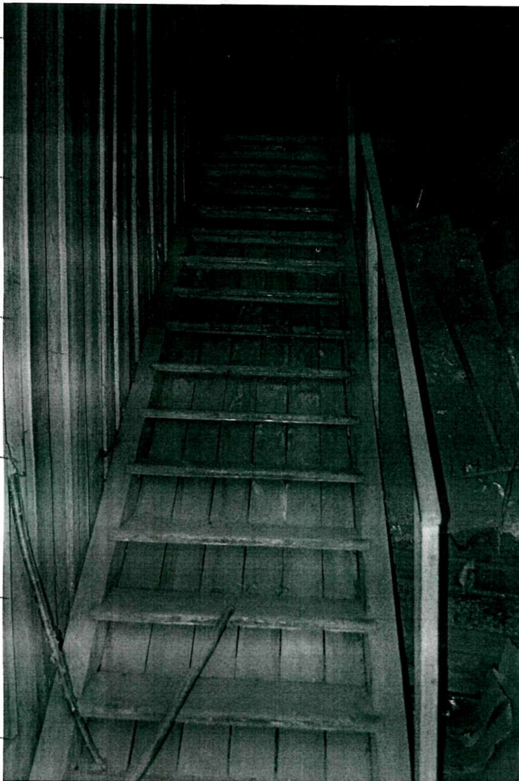
Фото 10. Интерьер; северо-восточная лестница