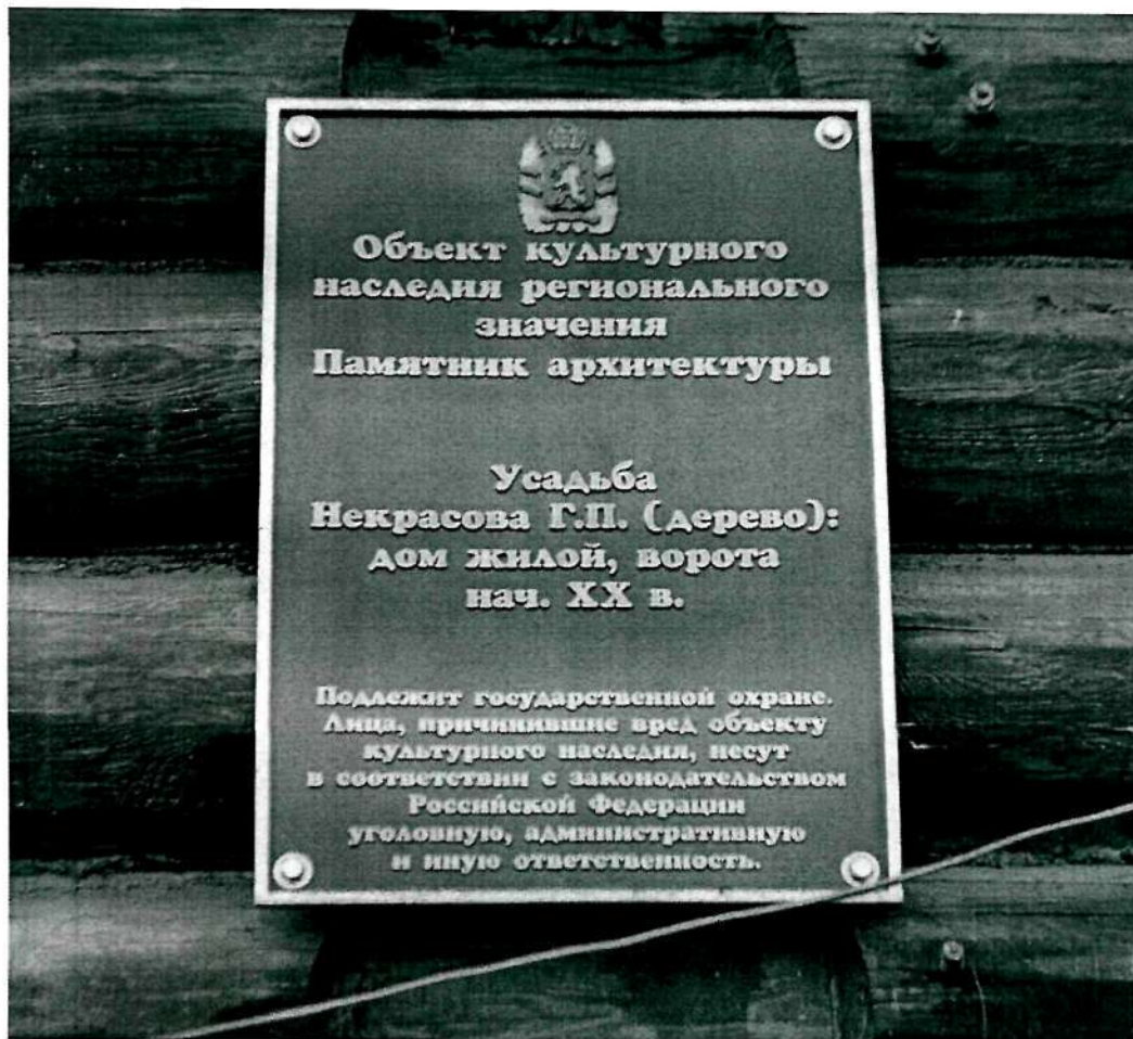
Фото 5. Надписи и обозначения, содержащие информацию об объекте