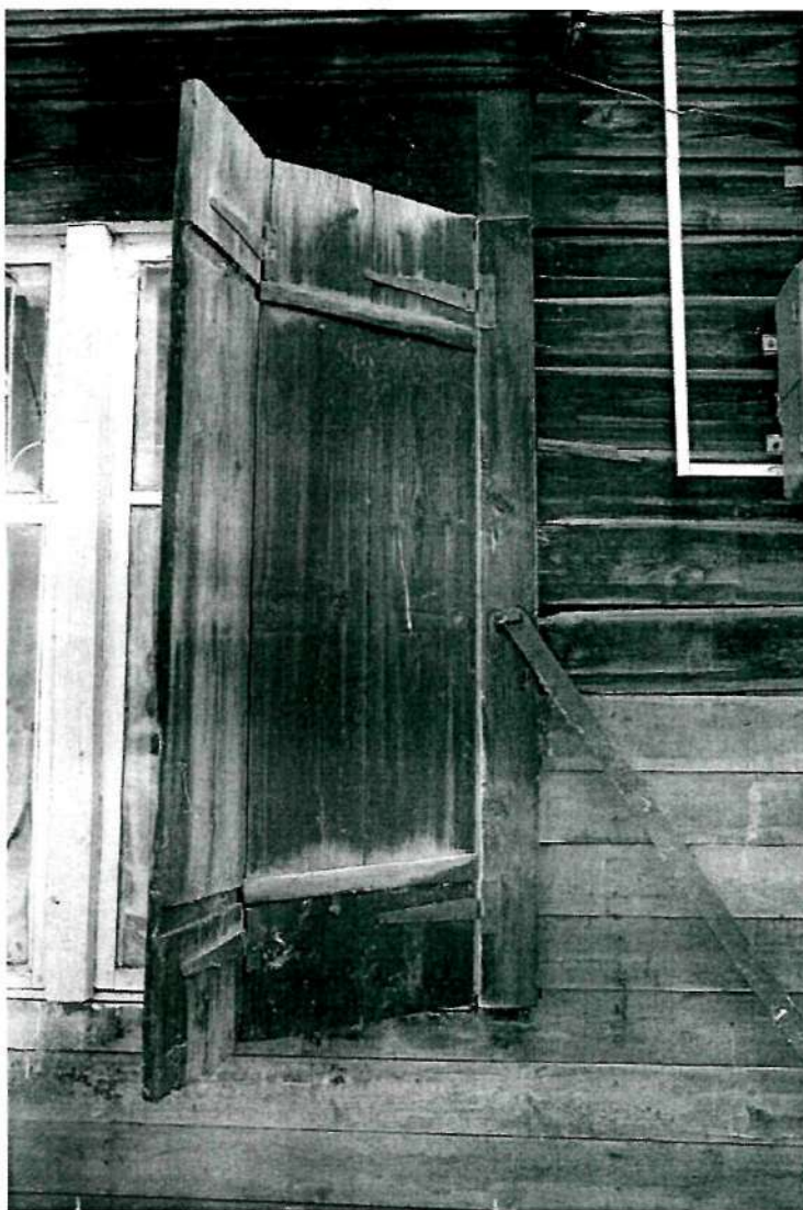
Фото 7. Западный фасад (деревянные ставни оконного проема)