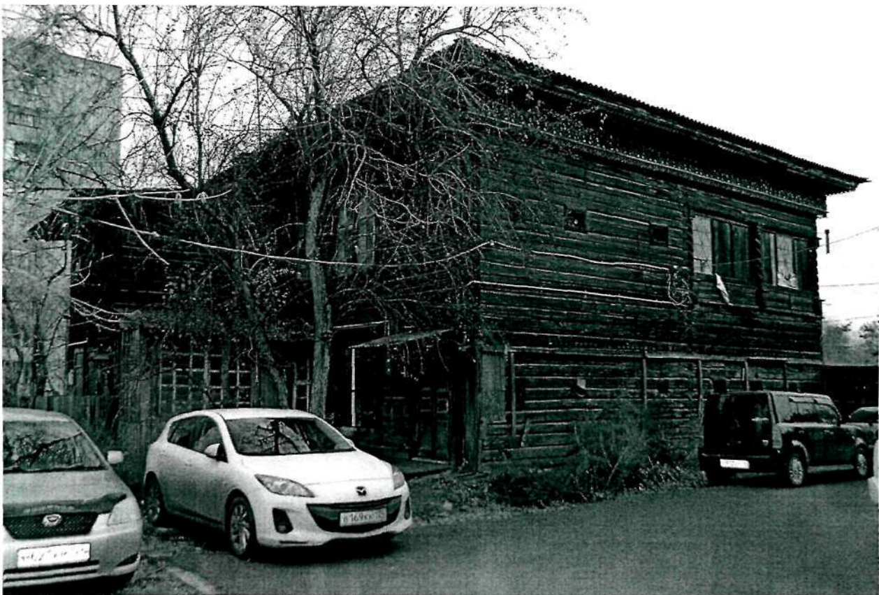
Фото 4. Южный фасад