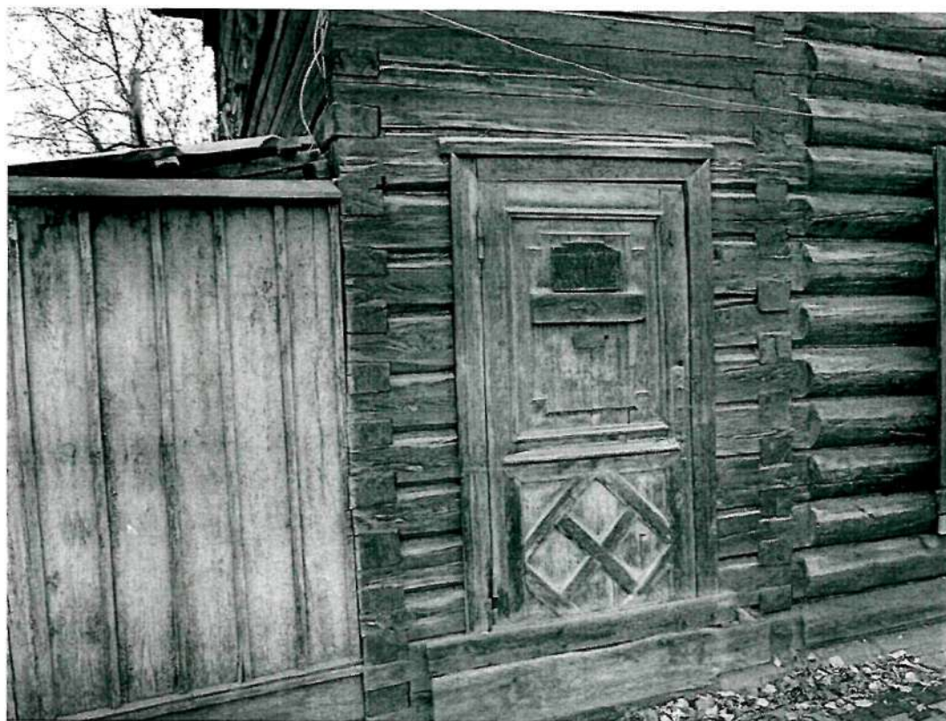
Фото 6 . Восточный фасад, филенчатая дверь юго-западного входа