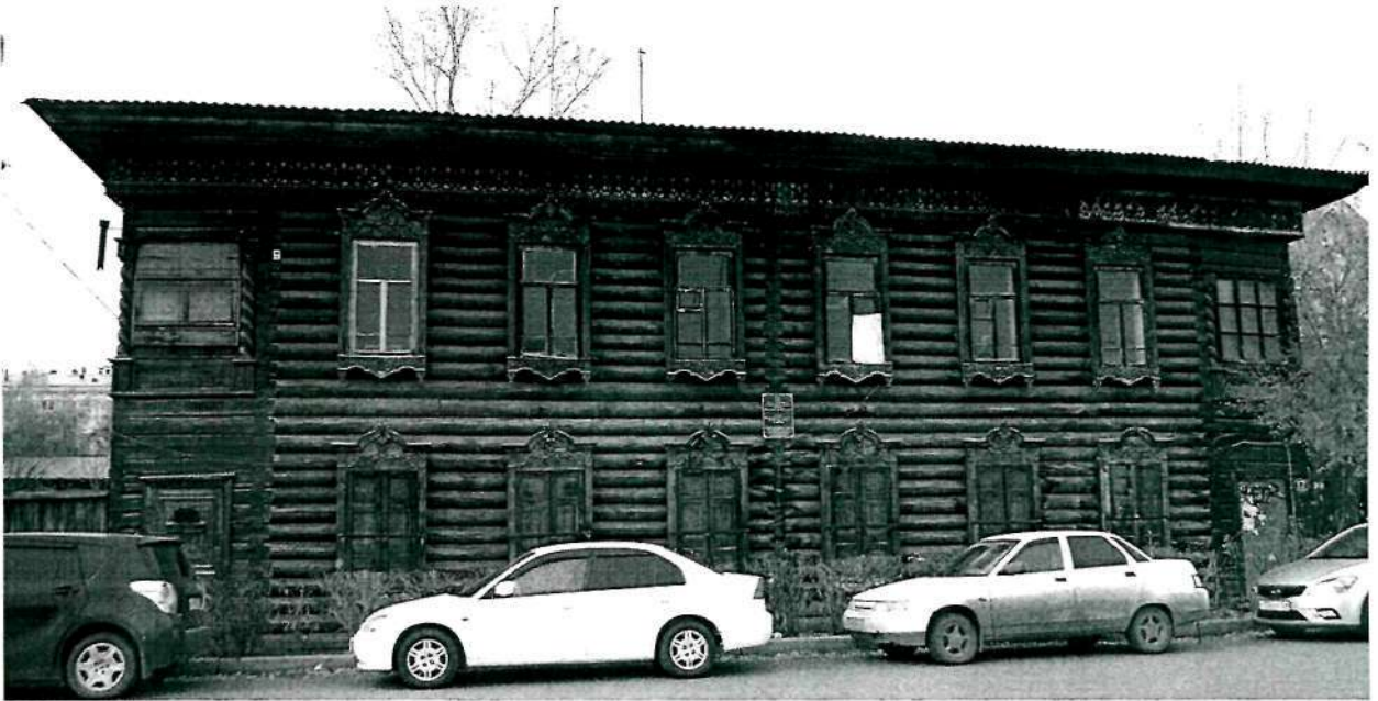
Фото 1. Восточный фасад

Приложение к акту технического состояния объекта культурного наследия регионального значения «Усадьба Некрасова Г.П. (дерево): дом жилой, ворота», нач. XX в., расположенного по адресу: г. Красноярск, ул. Горького, 17 (лит. А), от «28» октября 2015 г. № 133