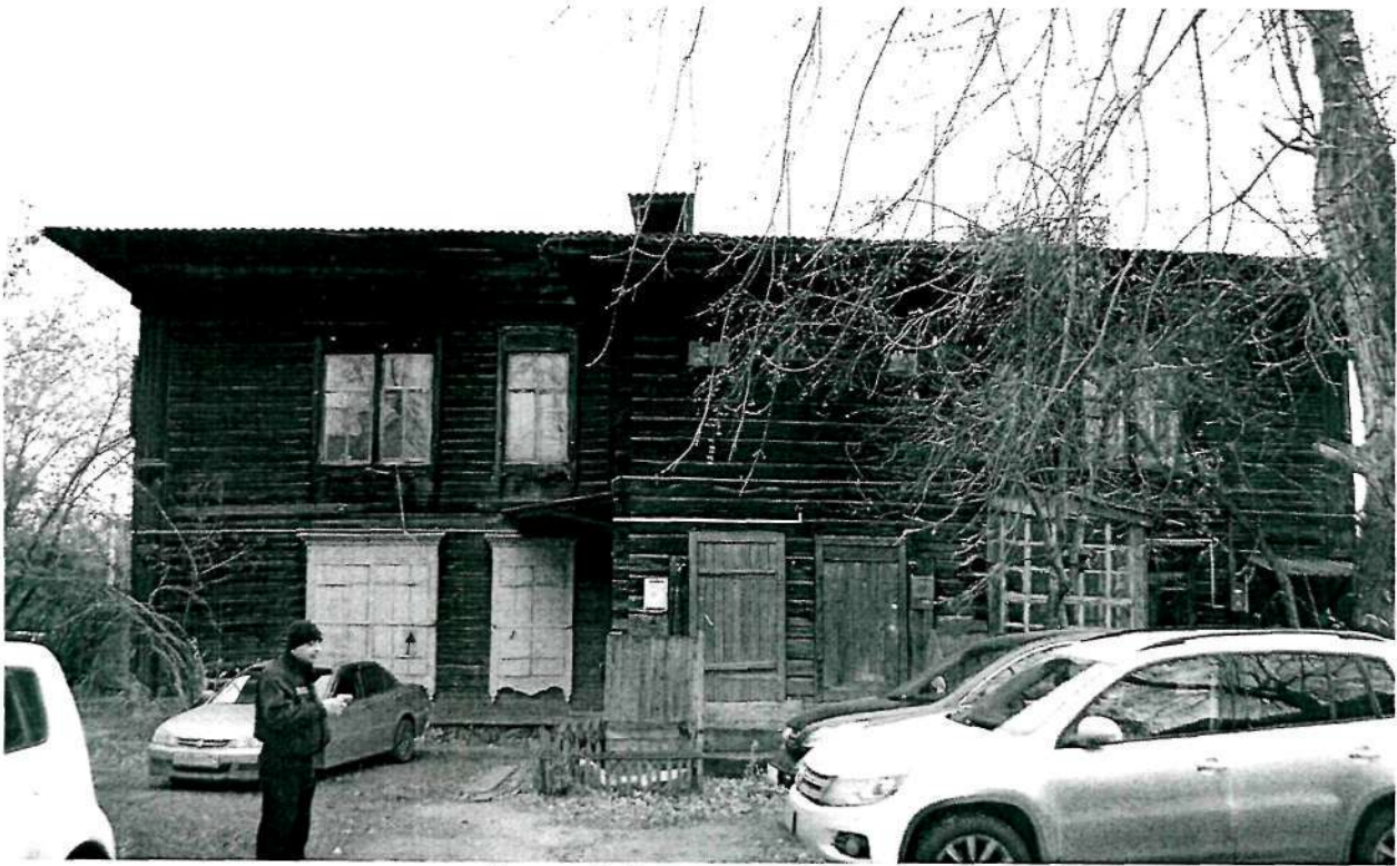
Фото 3. Западный фасад