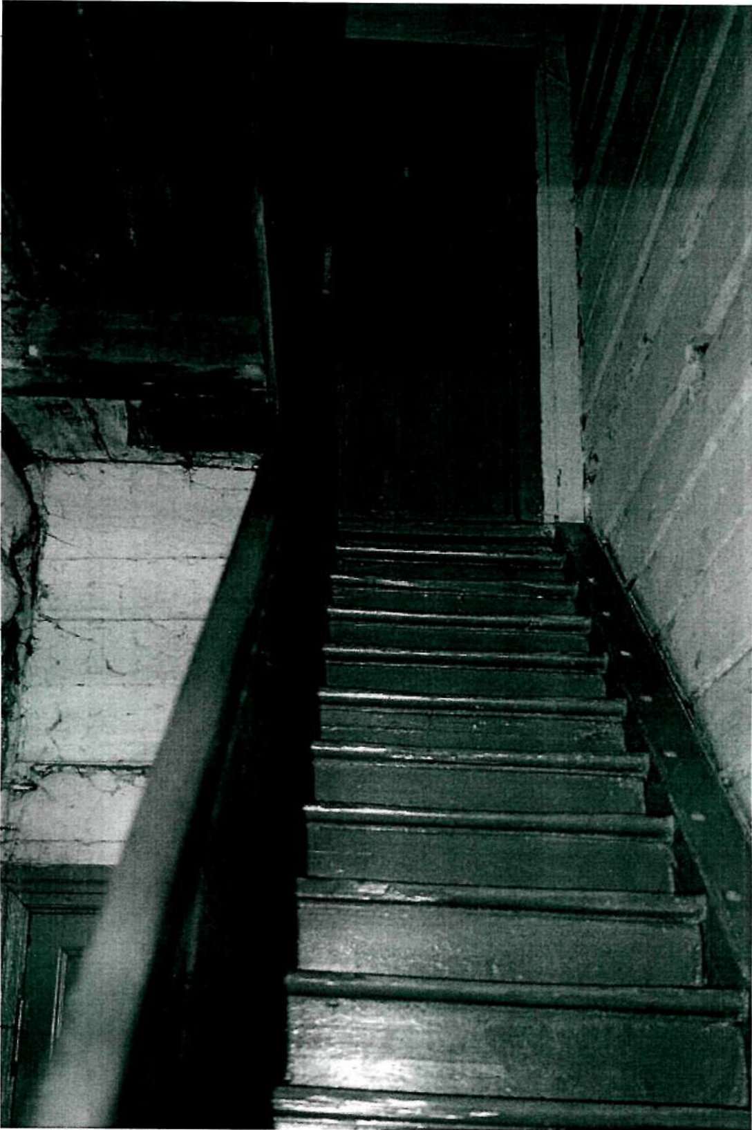
Фото 12 . Интерьер; юго-западная лестница с ограждением из точеных балясин (фрагмент 1), плотничная дверь в уровне второго этажа