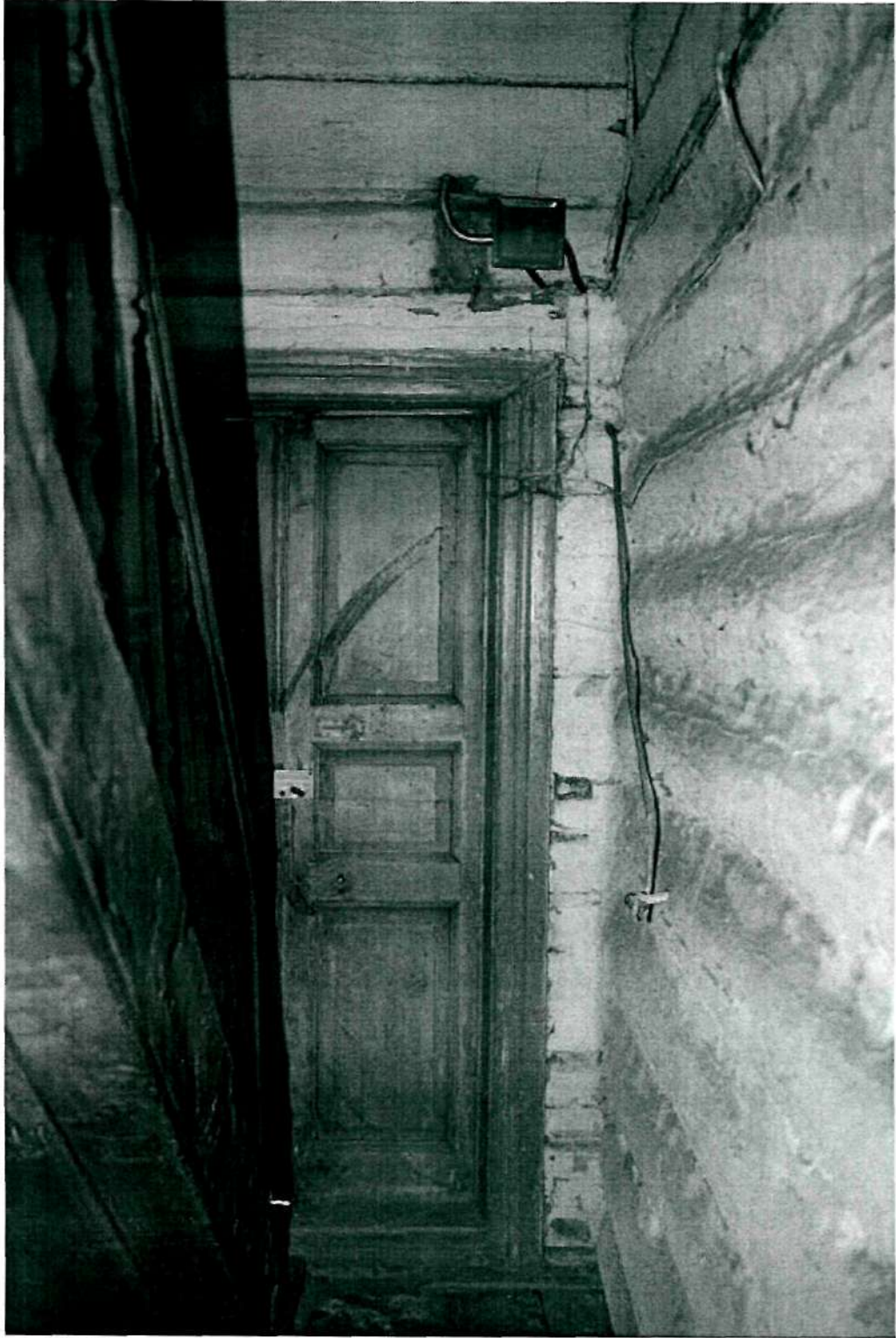
Фото 13 Интерьер; юго-западная лестница с ограждением из точеных балясин (фрагмент 2), филенчатая дверь входа