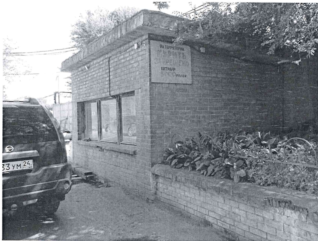
Объект № 2 - кирпичная (подпорная) стена