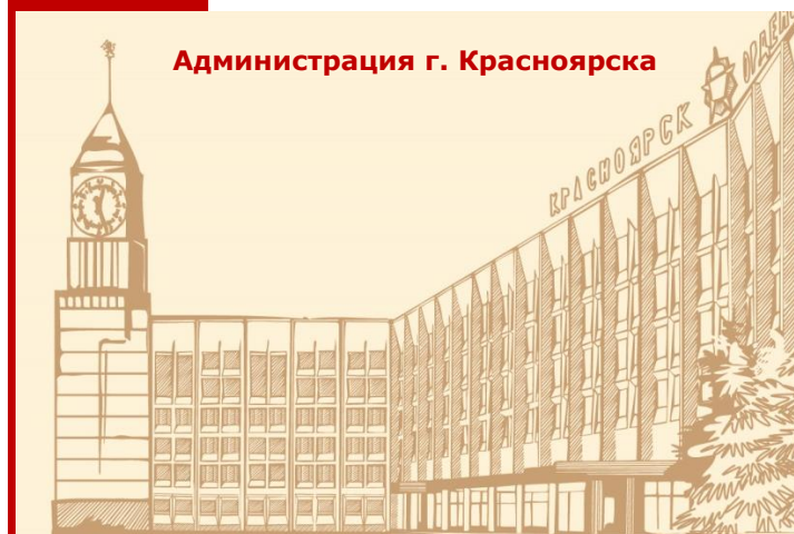
Администрация г. Красноярск

ВАЖНО! Заявление, поданное в электронной форме, обладает такой же юридической силой и влечет такие же юридические последствия, как и поданное при личном обращении